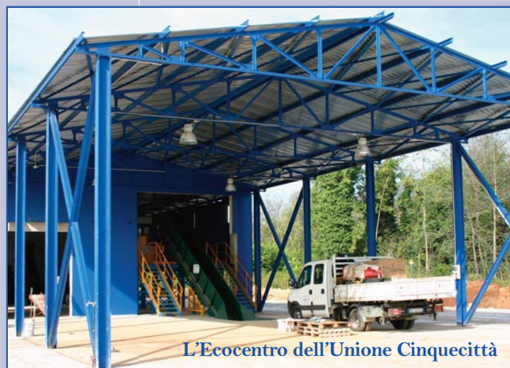
L'Ecocentro dell'Unione Cinquecittà