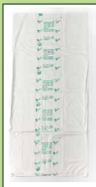
Il sacchetto in mater-bi che si decompone

* Ricorda di inserire il sacchetto in mater-bi (che si decompone) nel contenitore piccolo dell'organico in cui verserai i rifiuti umidi. Usa il sacchetto che ti ha fornito l'Unione Cinquecittà; se li hai terminati e vuoi utilizzare il sac-