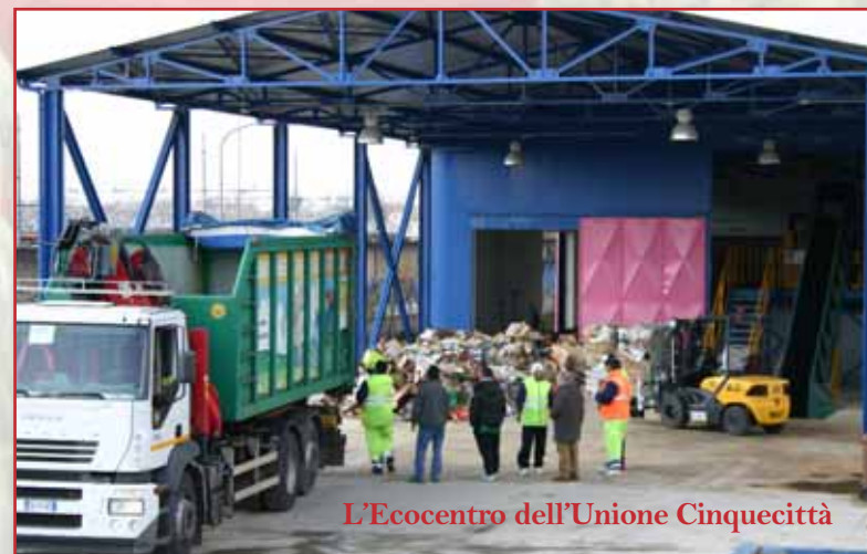
L'Ecocentro dell'Unione Cinquecittà