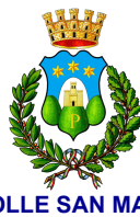
COLLE SAN MAGNO