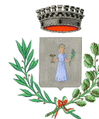
VILLA SANTA LUCIA