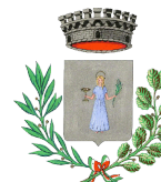
VILLA SANTA LUCIA