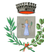
VILLA SANTA LUCIA