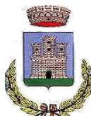
PIEDIMONTE SAN GERMANO