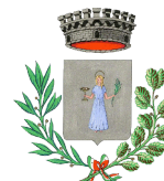
VILLA SANTA LUCIA