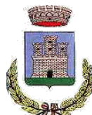
PIEDIMONTE SAN GERMANO