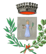
VILLA SANTA LUCIA

A riguardo la deliberazione della Giunta Regionale n. 49 del 31/01/2019 individua le linee guida sulla cui base sviluppare l'aggiornamento del Piano regionale di gestione dei rifiuti della Regione Lazio, approvato con deliberazione del consiglio regionale n. 14 del 18 gennaio 2012. In particolare, portare la raccolta differenziata almeno al 70% nel 2025 : il primo obiettivo è portare la raccolta differenziata almeno al 70%. Per raggiungerlo sarà necessario continuare a finanziare i Comuni nei progetti di miglioramento della raccolta con un fondo di 57 milioni di euro per i prossimi 3 anni con cui realizzare isole ecologiche, impianti di compostaggio e di auto-compostaggio. Sarà favorito inoltre il passaggio all'applicazione della tariffa puntuale in tutti i comuni della Regione. Un meccanismo che permetterà all'utente di pagare in base ai rifiuti indifferenziati prodotti: secondo il principio "chi meno rifiuti produce, meno paga".