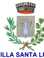
VILLA SANTA LUCIA