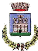
PIEDIMONTE SAN GERMANO