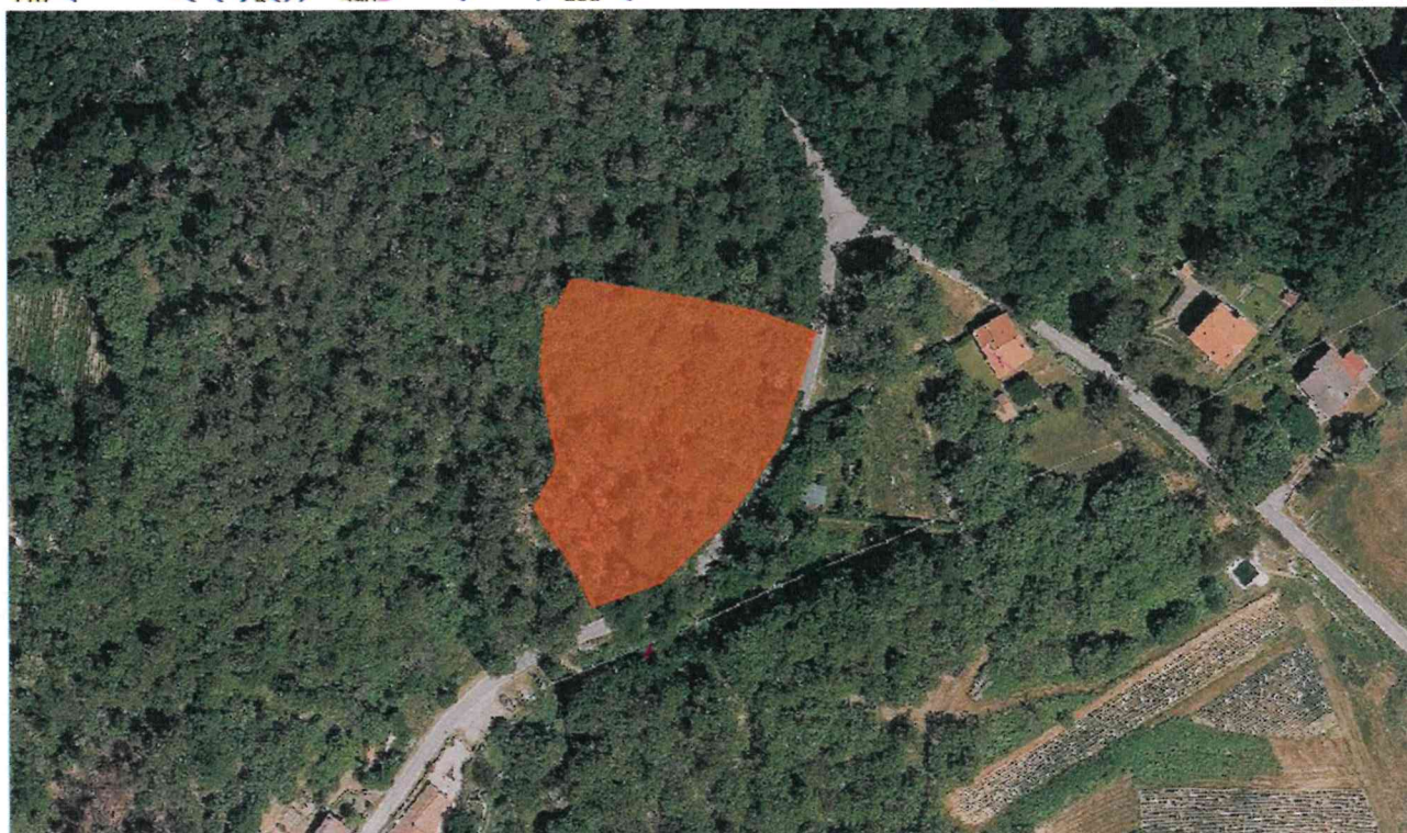
Individuazione delle Aree percorse da incendi su estratto catastale e su Ortofoto (Anno 2019) – Scala 1:2000