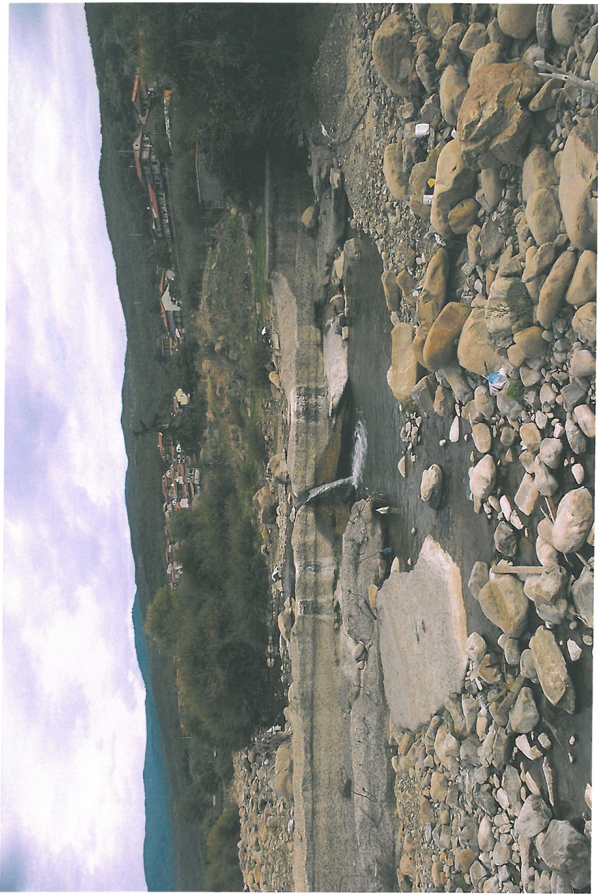
Foto n.10 – Argine torrente in corrispondenza della briglia sezioni 15/16

Rifer. num. Tavola n.7 – Rilievo Fotografico Planimetria con punti di vista