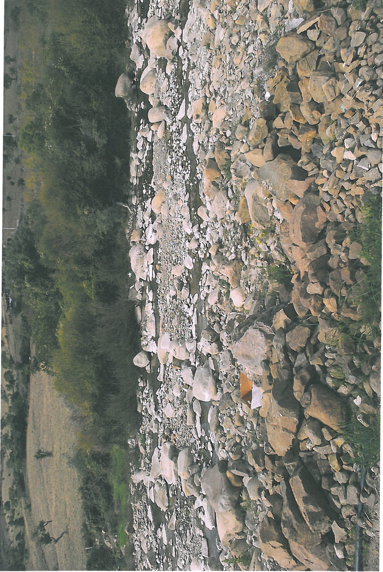
Foto n.6 - Vista dell'alveo presso la sezione 13 dall'argine est

Rifer. num. Tavola n.7 – Rilievo Fotografico Planimetria con punti di vista