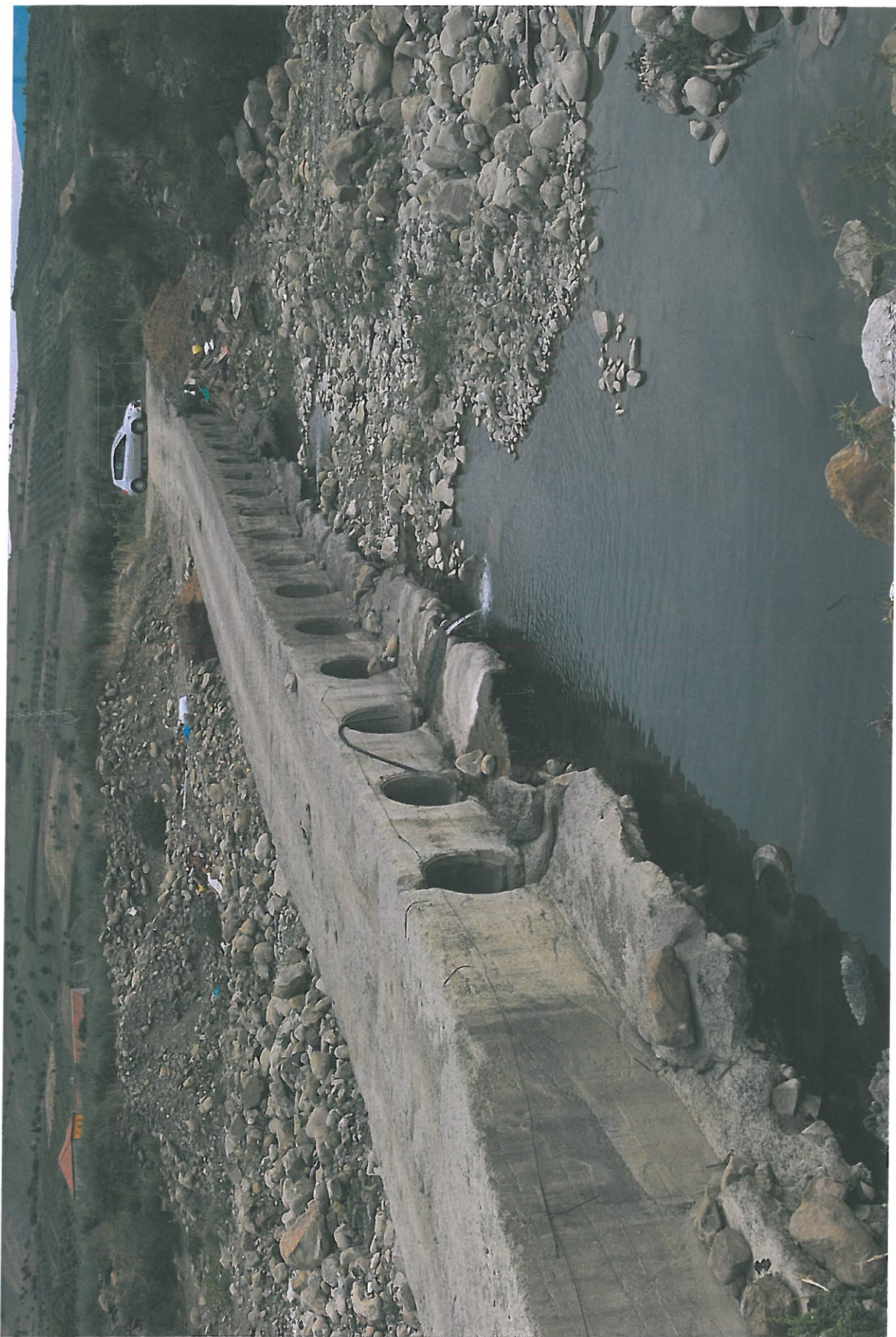
Foto n.24 – Passerella alle sezioni 62-63 con tubazioni esistenti

Rifer. num. Tavola n.7 – Rilievo Fotografico Planimetria con punti di vista