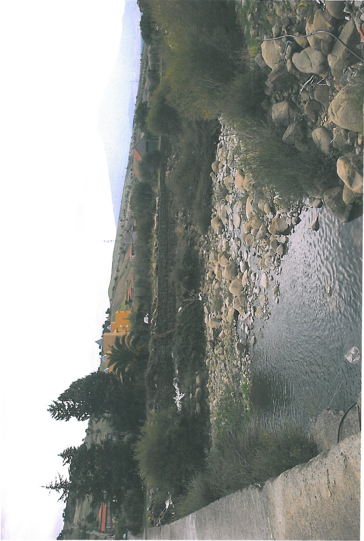
Foto n.11 - Argine del Torrente a sud delle sezioni 23/24 – Gabbioni esistenti

Rifer. num. Tavola n.7 – Rilievo Fotografico Planimetria con punti di vista