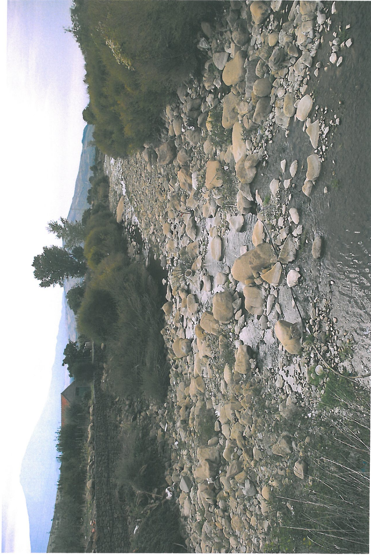
Foto n.13 - Vista dell'alveo verso valle dalla sezione 24 – Gabbioni esistenti

Rifer. num. Tavola n.7 – Rilievo Fotografico Planimetria con punti di vista