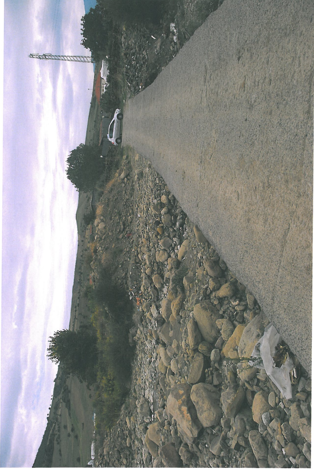
Foto n.17 - Vista dell'alveo dalla passerella alle sezioni 41-42 verso lato nord-est

Rifer. num. Tavola n.7 – Rilievo Fotografico Planimetria con punti di vista