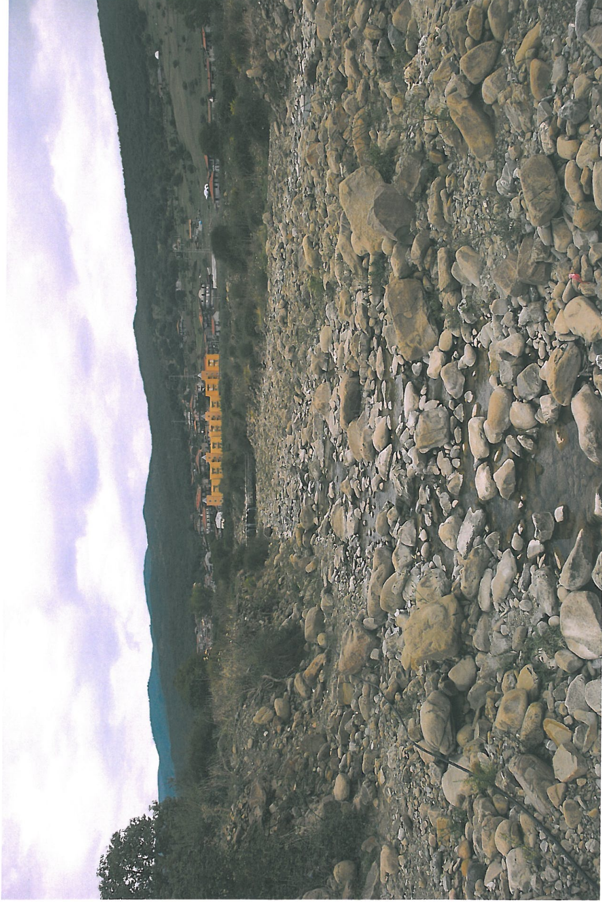
Foto n.16 - Vista dell'alveo dalla passerella alle sezioni 41-42 verso nord

Rifer. num. Tavola n.7 – Rilievo Fotografico Planimetria con punti di vista