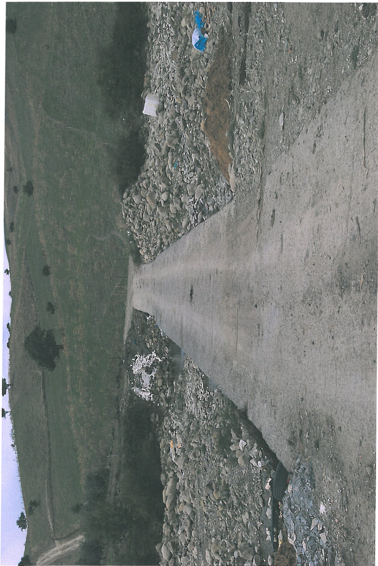
Foto n.21 - Passerella alle sezioni 62-63 verso ovest

Rifer. num. Tavola n.7 – Rilievo Fotografico Planimetria con punti di vista