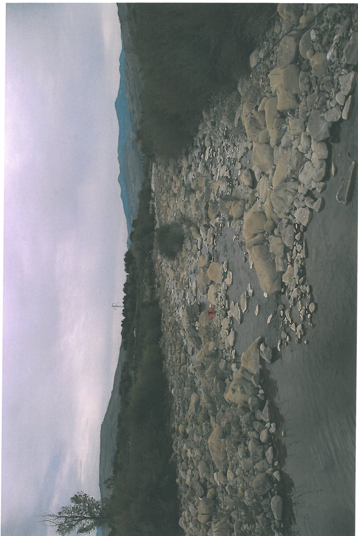
Foto n.19 - Vista dell'alveo dalla passerella alle sezioni 41-42 verso valle

Rifer. num. Tavola n.7 – Rilievo Fotografico Planimetria con punti di vista