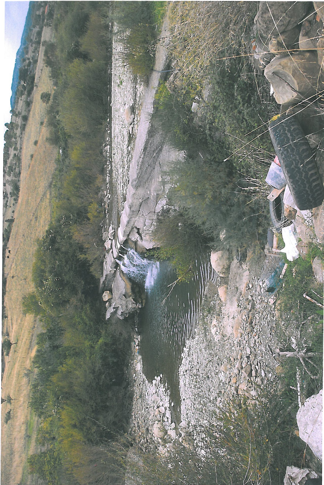
Foto n.14 - Salto dell'alveo sezioni 27-28

Rifer. num. Tavola n.7 – Rilievo Fotografico Planimetria con punti di vista