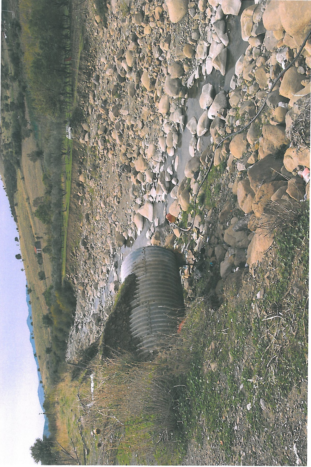
Foto n.3 - Tombino armco presso l'argine alla sezione 8

Rifer. num. Tavola n.7 – Rilievo Fotografico Planimetria con punti di vista