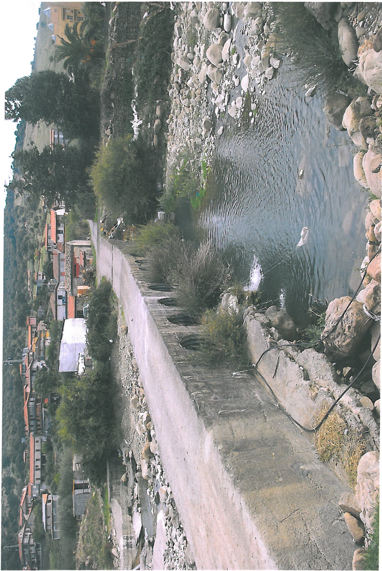
Foto n.12 - Passerella alle sezioni 18/19

Rifer. num. Tavola n.7 – Rilievo Fotografico Planimetria con punti di vista