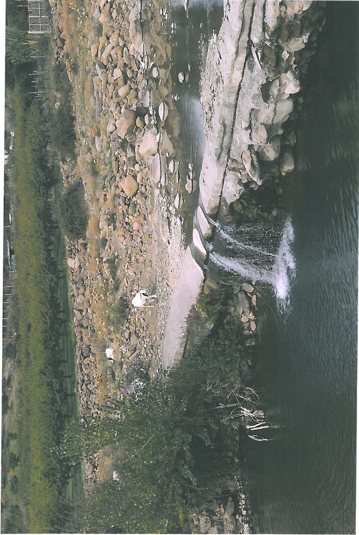
Foto n.1 - Salto dell'alveo alla sezione 3

Rifer. num. Tavola n.7 – Rilievo Fotografico Planimetria con punti di vista