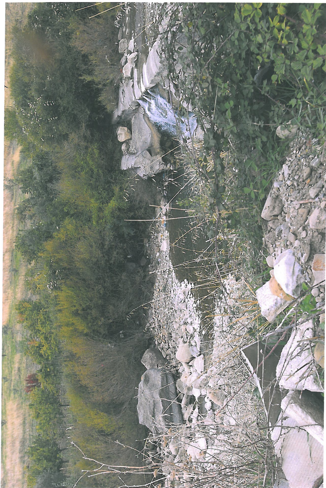
Foto n.15 - Salto dell'alveo sezioni 27-28 Vista in dettaglio

Rifer. num. Tavola n.7 – Rilievo Fotografico Planimetria con punti di vista