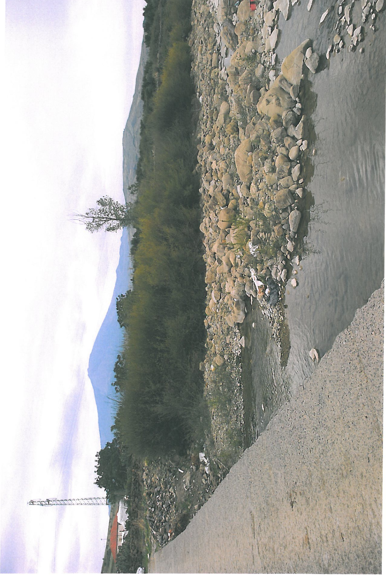
Foto n.18 - Vista dell'alveo dalla passerella alle sezioni 41-42 verso lato sud-est

Rifer. num. Tavola n.7 – Rilievo Fotografico Planimetria con punti di vista