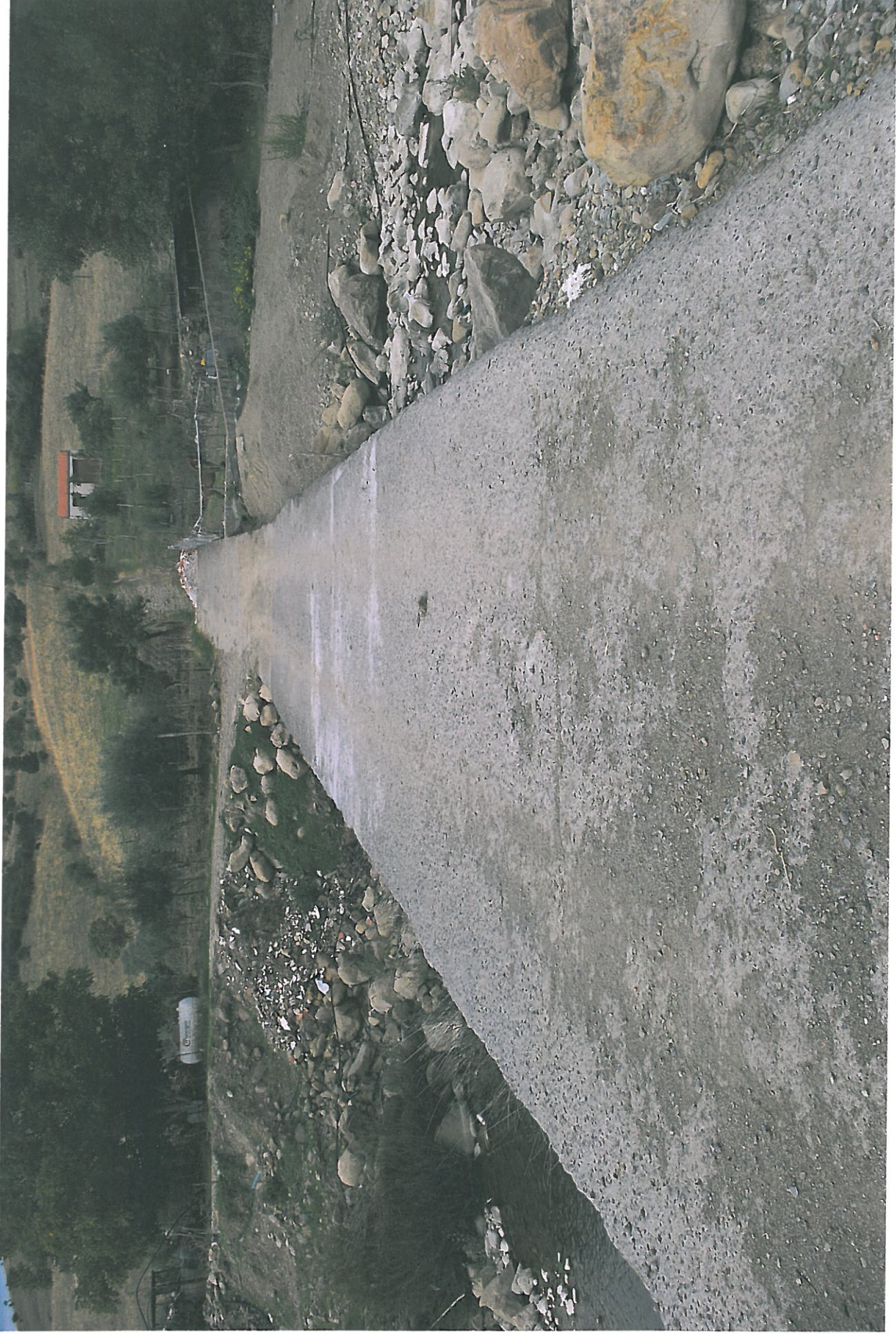
Foto n.9 - Passarella alle sezioni 18/19

Rifer. num. Tavola n.7 – Rilievo Fotografico Planimetria con punti di vista