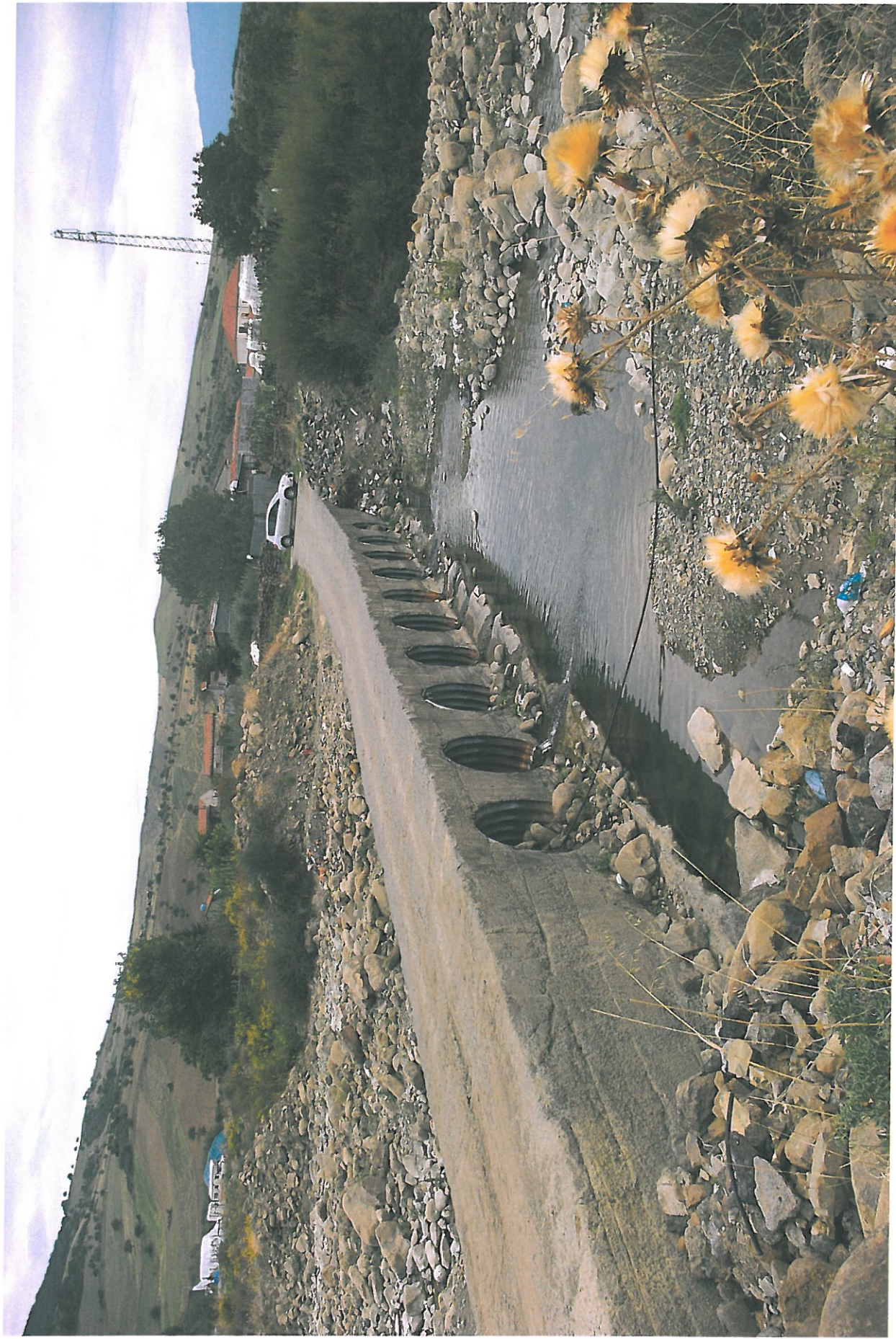
Foto n.20 - Vista da ovest della passerella alle sezioni 41-42

Rifer. num. Tavola n.7 – Rilievo Fotografico Planimetria con punti di vista