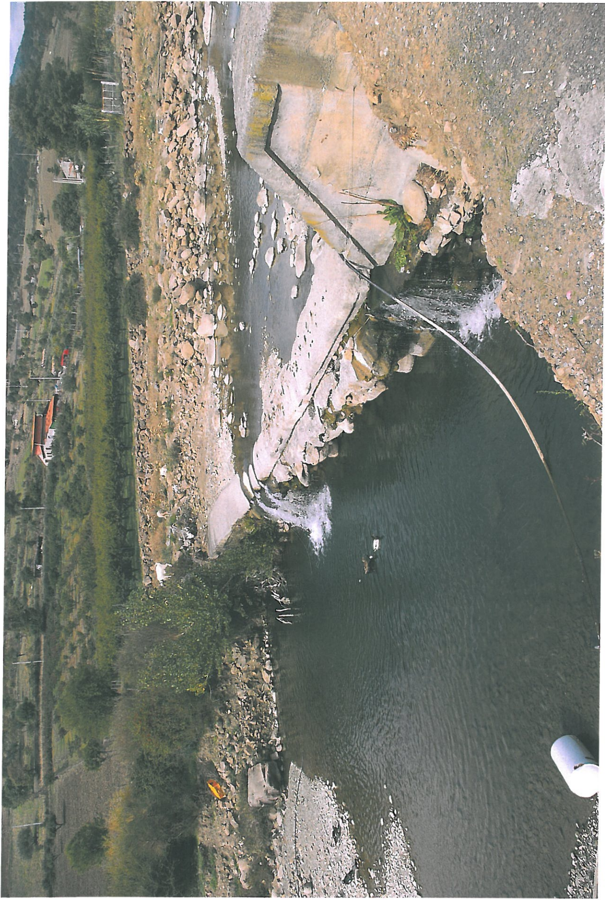
Foto n.2 - Vista dall'argine del salto dell'alveo alla sezione 3

Rifer. num. Tavola n.7 – Rilievo Fotografico Planimetria con punti di vista