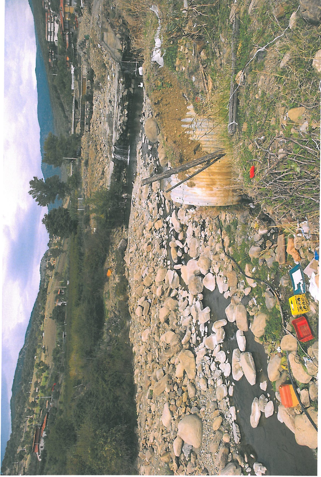
Foto n.4 - Vista del tombino armco dalla sezione 8 verso monte

Rifer. num. Tavola n.7 – Rilievo Fotografico Planimetria con punti di vista