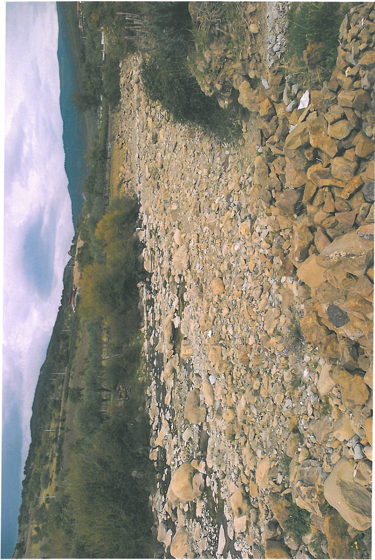
Foto n.7 - Vista dell'alveo verso monte dalla sezione 14

Rifer. num. Tavola n.7 – Rilievo Fotografico Planimetria con punti di vista