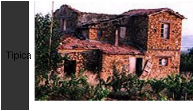
Tipica casa coloniale.