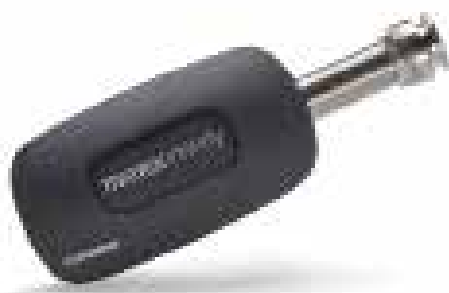
EFI PRO-MAN-NFV EFI PRO-MAT-NFV EFI PRO-MAK-NFV EFI PRO-MAL-NFV