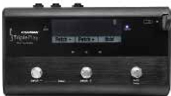
TriplePlay FC-1 Foot Controller