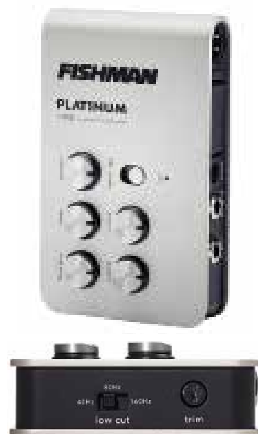
PRO-PLT-301 PLATINUM STAGE EQ/DI