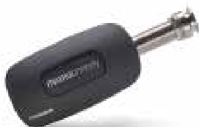
EFI PRO-MAN-MBV EFI PRO-MAT-MBV