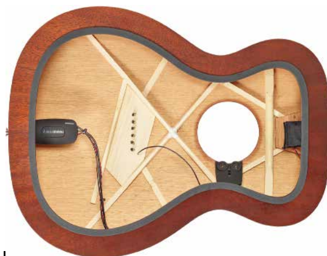
I Matrix Infinity Mic Blend Narrow preamplificatore onboard per chitarra acustica