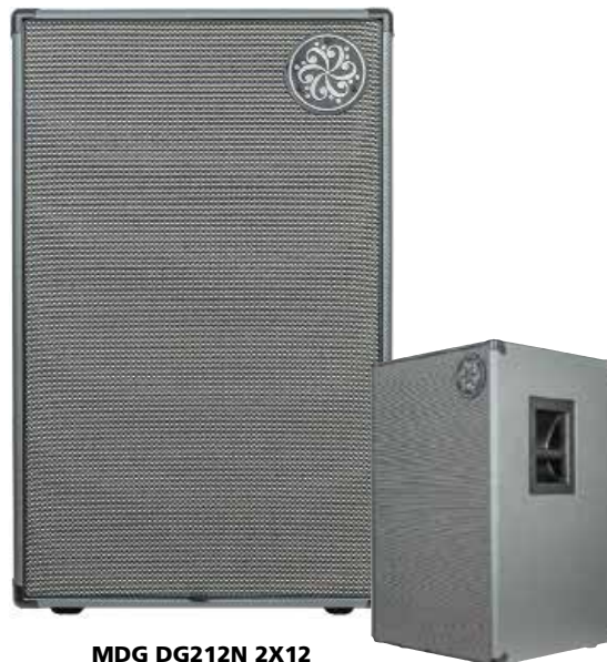
MDG DG212N 2X12