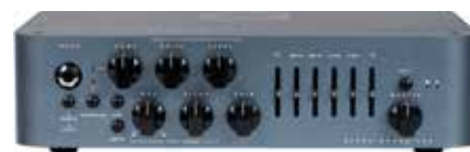
MDG ALPHA OMEGA 900

Dimensioni (cm): 26,7x25,5x7,1 Peso(kg): 2,4