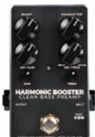
MDG HARMONIC BOOSTER