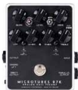
MDG MICROTUBES B7K