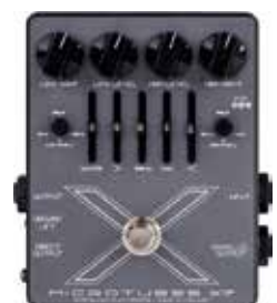
MDG MICROTUBES X7