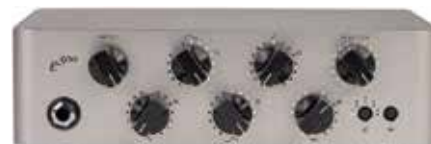
MDG EXPONENT 500