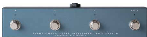
MDG ALPHA OMEGA SUPER INTELLI- GENT FOOTSWITCH