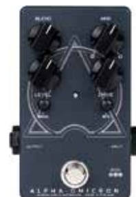
MDG ALPHA OMICRON