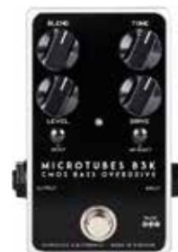
MDG MICROTUBES B3K