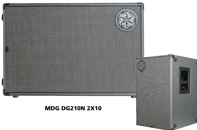
MDG DG210N 2X10