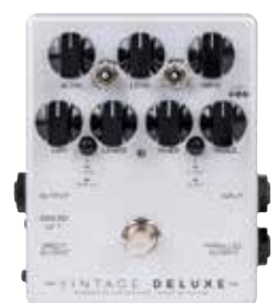
MDG VINTAGE DELUXE