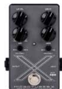
MDG MICROTUBES X