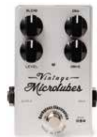
MDG VINTAGE MICROTUBES