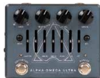
MDG ALPHA OMEGA ULTRA