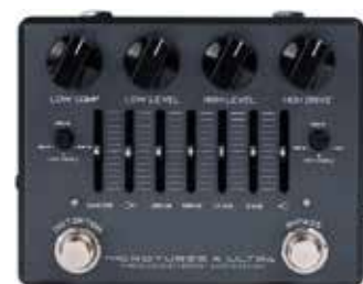
MDG MICROTUBES X ULTRA