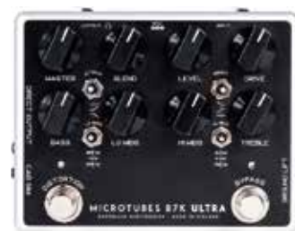
MDG MICROTUBES B7K ULTRA