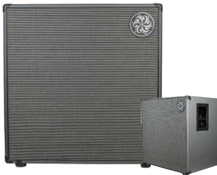
MDG DG410N 4X10