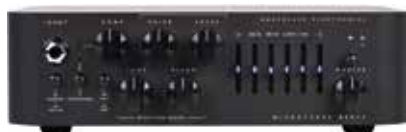
MDG MICROTUBES 500