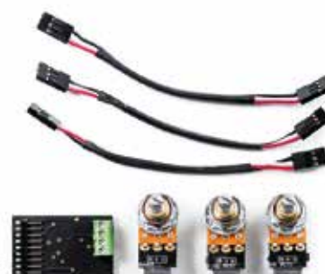
MDG TONE CAPSULE 2.0