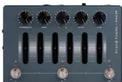
MDG ALPHA OMEGA PHOTON