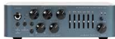
MDG ALPHA OMEGA 500

Dimensioni (cm): 23x18x7,1 Peso(kg): 2,4