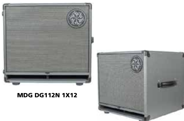
MDG DG112N 1X12