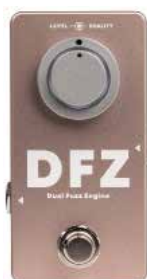
MDG DUALITY FUZZ