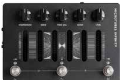
MDG MICROTUBES INFINITY