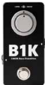
MDG MICROTUBES B1K