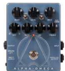
MDG ALPHA OMEGA