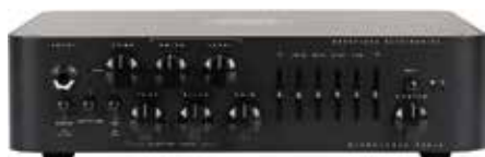
MDG MICROTUBES 900