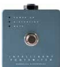
MDG ALPHA OMEGA INTELLIGENT FOOTSWITCH