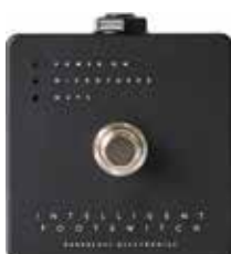
MDG INTELLIGENT FOOTSWITCH