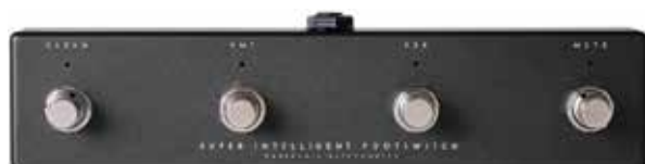
MDG SUPER INTELLIGENT FOOTSWITCH