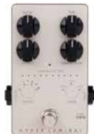
MDG HYPER LUMINAL