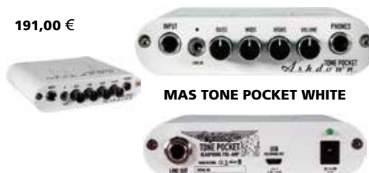
MAS TONE POCKET WHITE