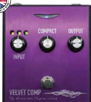
MAS VELVET COMPRESSOR