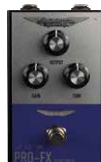
MAS RETRO DRIVE