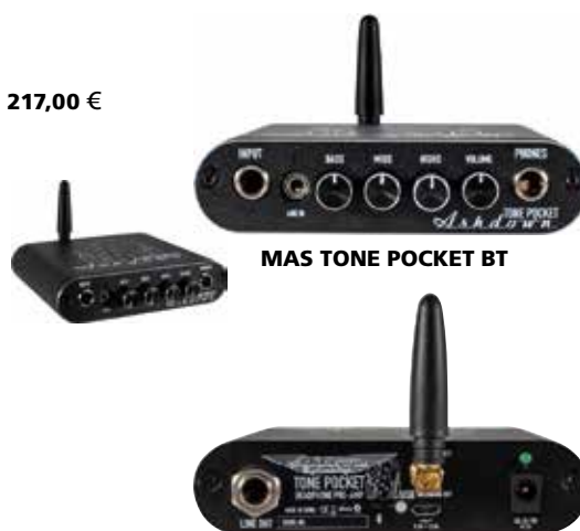
MAS TONE POCKET BT