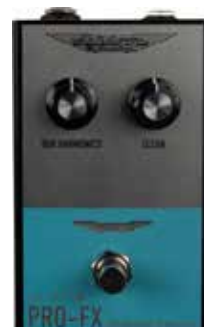
MAS ABM PRO-FX SUB HARMONIC GENERATOR