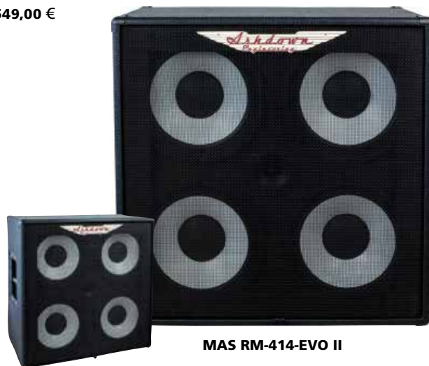
MAS RM-414-EVO II