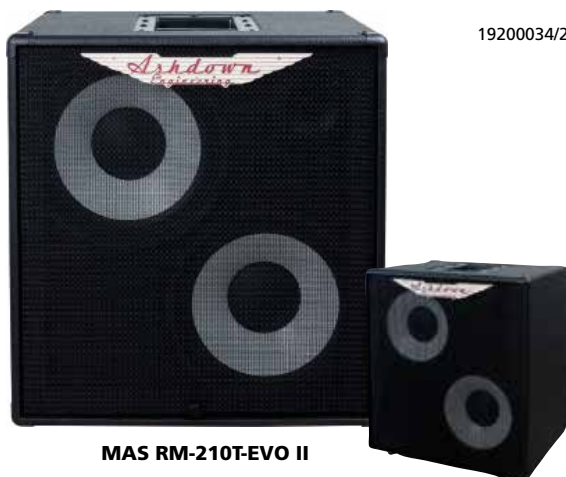
MAS RM-210T-EVO II

Potenza: 300 Watt Configurazione altoparlanti: 1 x 15" + Tweeter Uscite altoparlanti: Speakon Impedenza: 8 Ohm Dimensioni (mm): 490 x 470 x 335 (H:+15mm) per i piedini) Peso (kg): 14