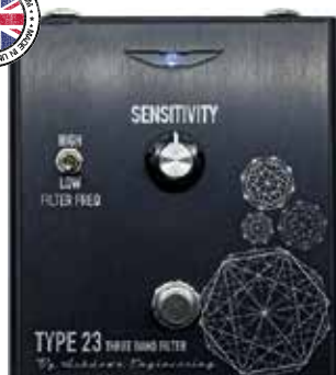
MAS TYPE 23