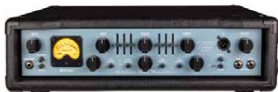
MAS ABM 300 EVO IV