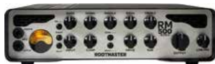
MAS RM-500-EVO II