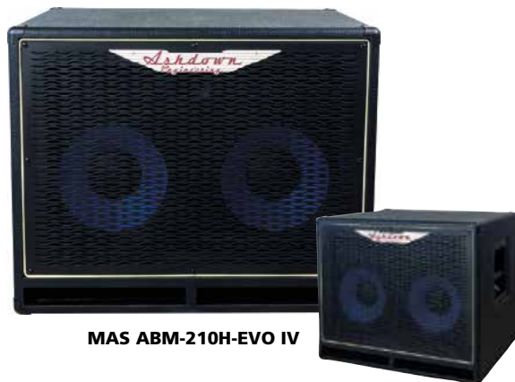
MAS ABM-210H-EVO IV