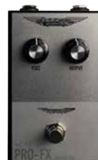
MAS VINTAGE FUZZ

Controlli: FUZZ, OUTPUT True Bypass: sì Assorbimento: 50 mA Alimentazione: a 9 V (non inclusa)