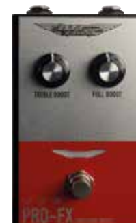
MAS TWO BAND BOOST

TREBLE BOOST: potenzia le frequenze alte FULL BOOST: potenzia tutto il resto True bypass: sì Assorbimento: 50 mA Alimentazione: 9 Volt (non inclusa)