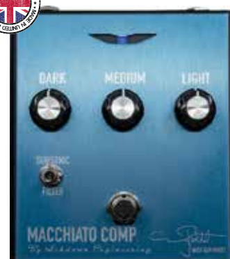
MAS MACCHIATO COMPRESSOR