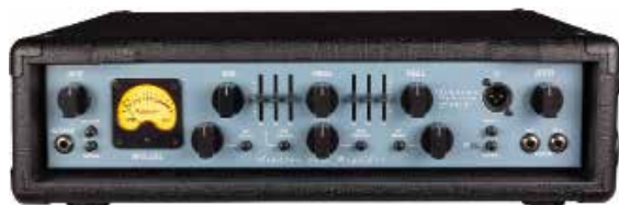
MAS ABM 600 EVO IV