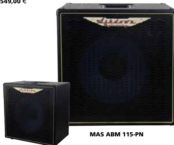
MAS ABM 115-PN