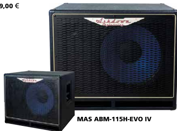
MAS ABM-115H-EVO IV