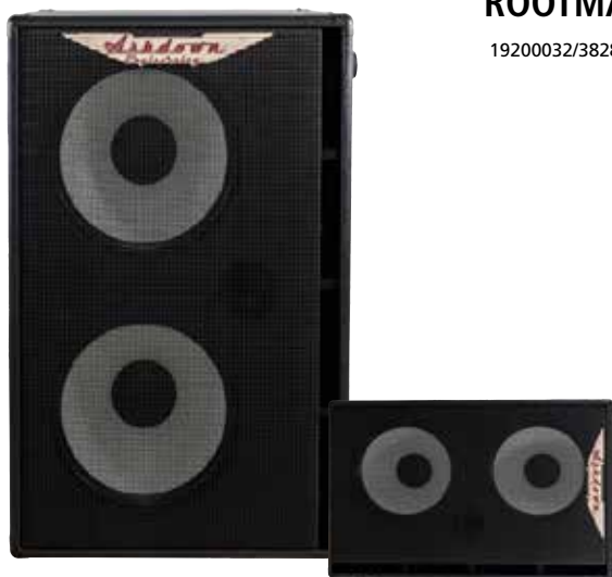
MAS RM-212-EVO II