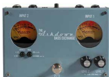
MAS THE BASS EXCHANGE

Bass Exchange è il Line Switcher di Ashdown dotato di 2xInput e 2xOutput pensato per tutti i bassisti che utilizzano 2 strumenti e/o 2 amplificatori