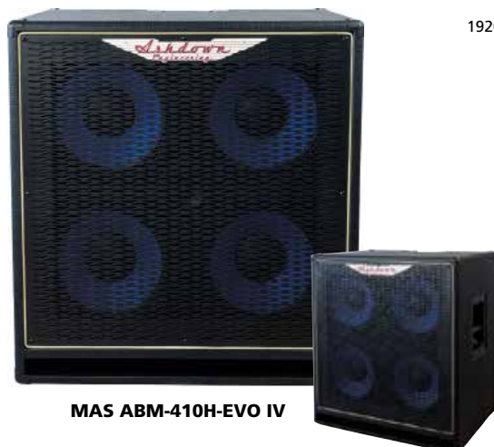
MAS ABM-410H-EVO IV