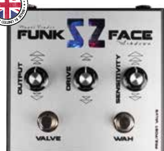
MAS FS-FUNK FACE