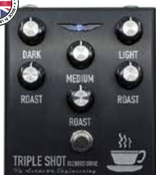
MAS TRIPLE SHOT