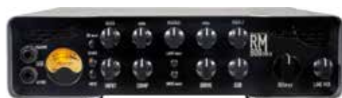
MAS RM-800-EVO II