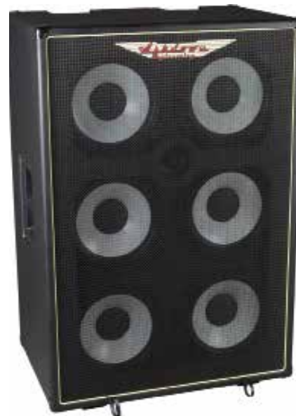
MAS RM-610T-EVO II