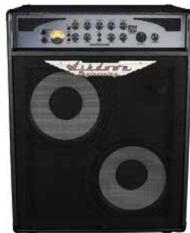
MAS RM-C210T-500-EVO II