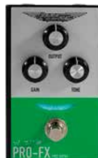
MAS ABM PRO-FX PRO DRIVE

Controlli: GAIN, OUTPUT, TONE True Bypass Assorbimento di 50 mA Alimentazione a 9 Volt (non inclusa)