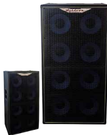
MAS ABM-810H-EVO IV