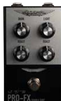
MAS ABM PRO-FX DOUBLE SHOT

DARK: controlla i bassi LIGHT: controlla gli alti ROAST: imposta la quantità di guadagno della banda di equalizzazione corrispondente. True bypass Assorbimento di 50 mA Alimentazione a 9 Volt (non inclusa)