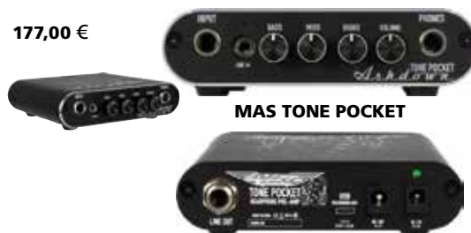
MAS TONE POCKET