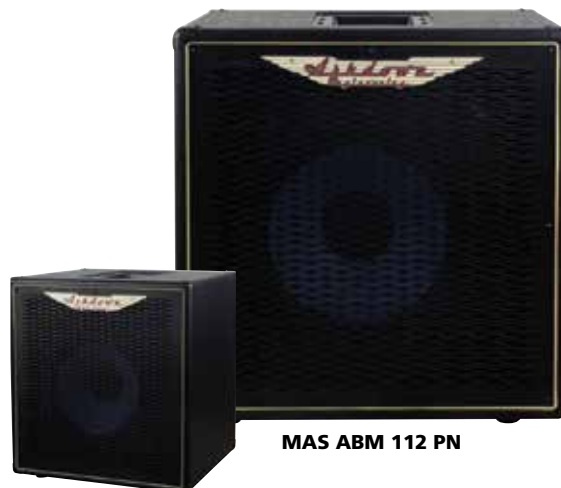
MAS ABM 112 PN