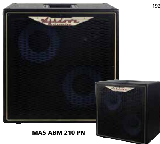
MAS ABM 210-PN