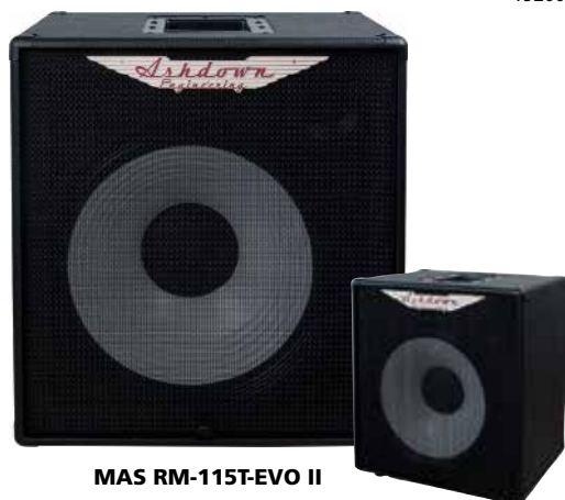
MAS RM-115T-EVO II

Potenza: 500 Watt Configurazione altoparlanti: 2 x 12" + Tweeter Uscite altoparlanti: Speakon Impedenza: 8 Ohm Dimensioni (mm): 717 x 463 x 342 (H:+15mm) per i piedini) Peso (kg): 14