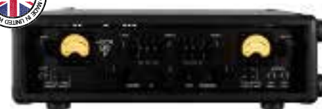
MAS ABM-750-EVO V