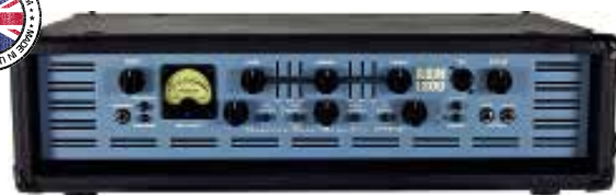
MAS ABM 1200 EVO IV