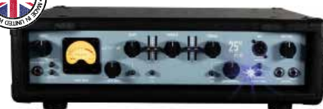
MAS ABM-400 25 LTD