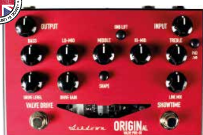
MAS FS-ORIGINAL VALVE PRE-DI