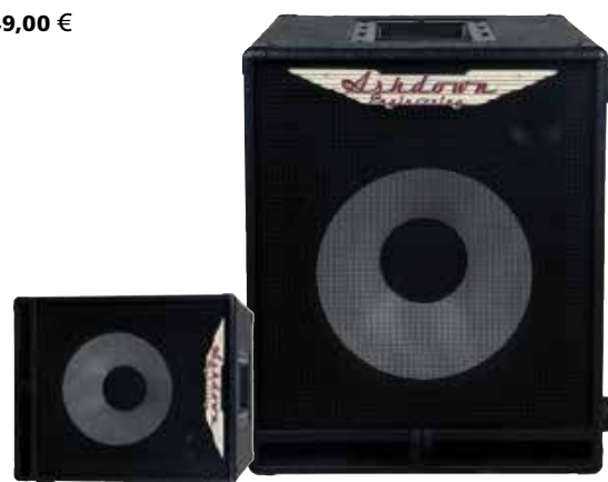
MAS RM-112T-EVO II