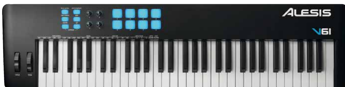
PAL ALESIS V61 MKII