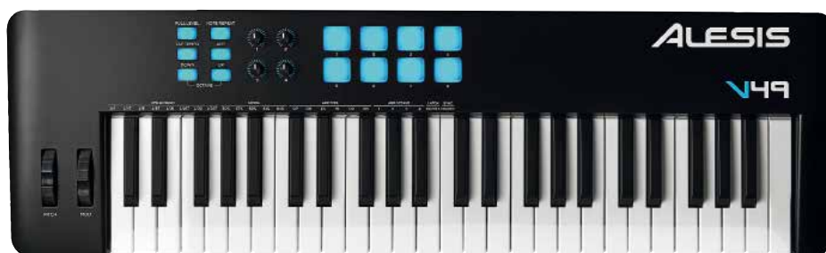
PAL ALESIS V49 MKII