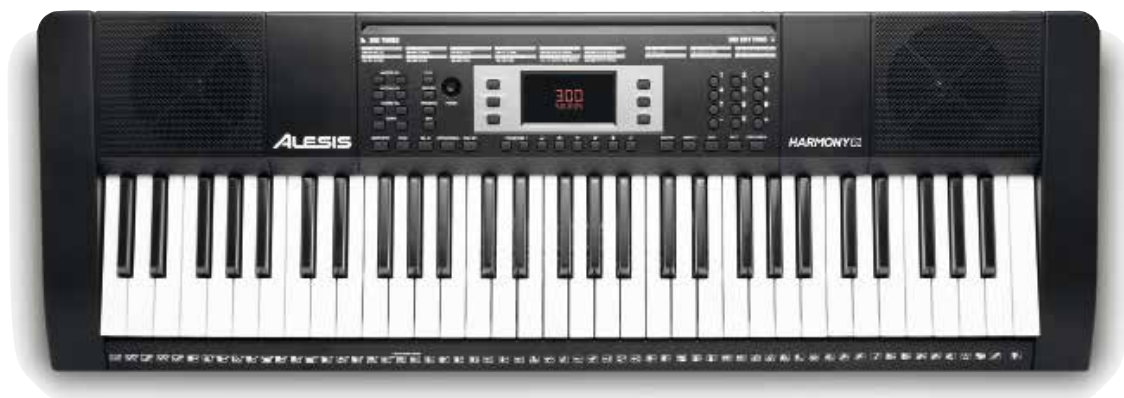
ALESIS HARMONY 61 MKII