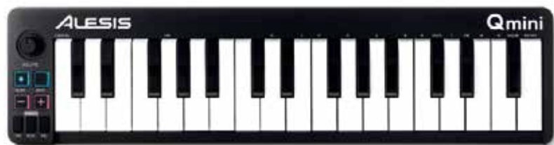
KAL Q MINI