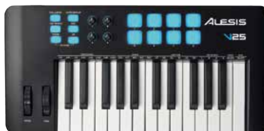
PAL ALESIS V25 MKII