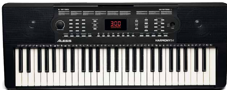
ALESIS HARMONY 54 MKII