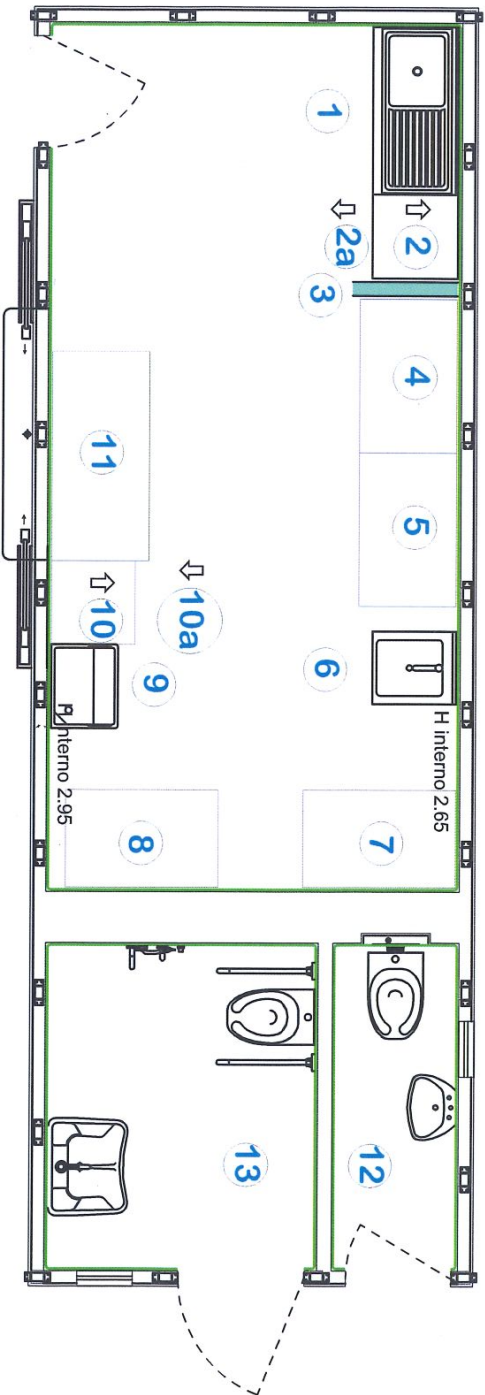
Planimetria con la localizzazione delle attrezzature e dei servizi