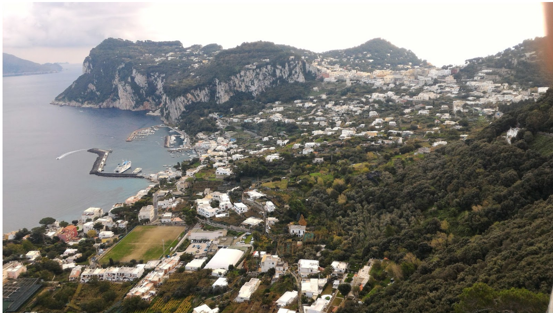
IMG. A01.O1. - FOTO DELLO STATO DEI LUOGHI

PROGETTO DI FATTIBILITA' RELAZIONE ILLUSTRATIVA