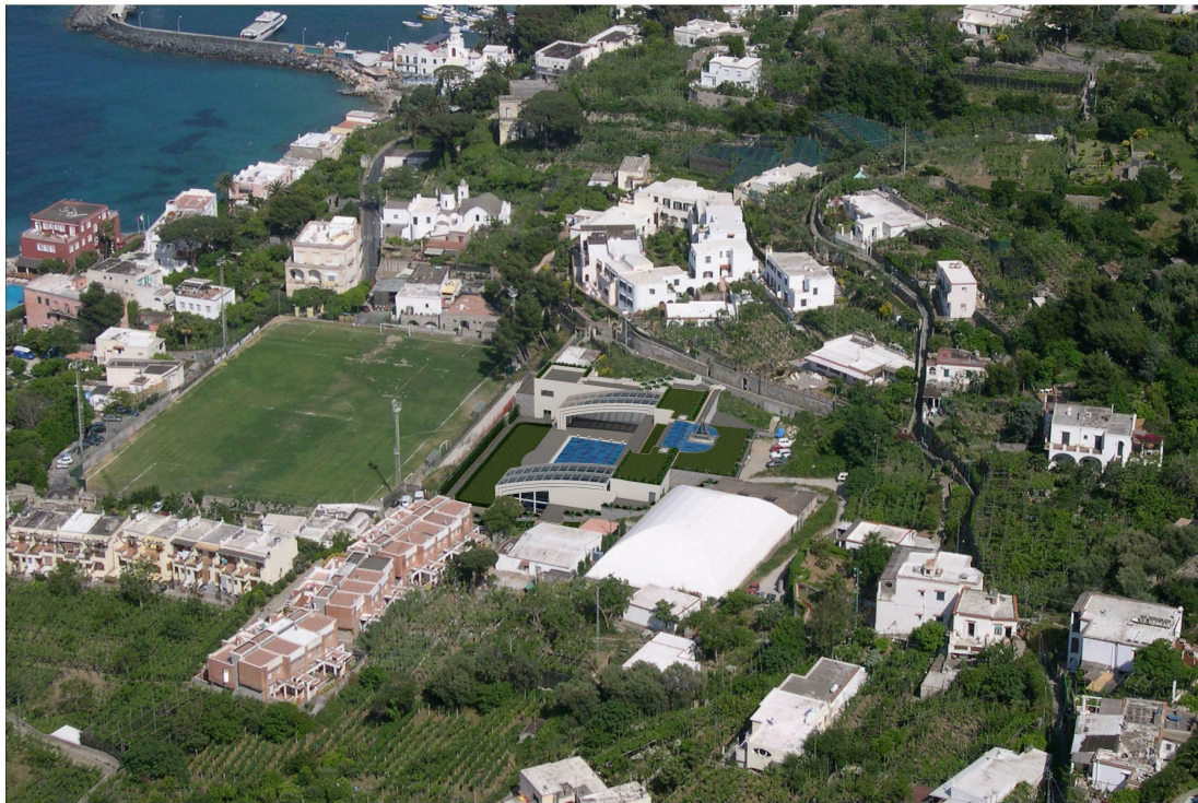
IMG. A01.10. - RENDER DALL'ALTO CON COPERTURA APERTA

PROGETTO DI FATTIBILITA' RELAZIONE ILLUSTRATIVA