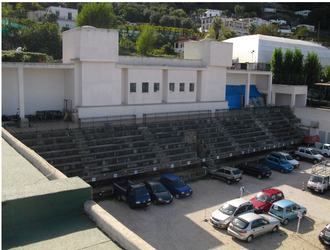
IMG. A01.06. - FOTO DELLO STATO DEI LUOGHI

PROGETTO DI FATTIBILITA' RELAZIONE ILLUSTRATIVA