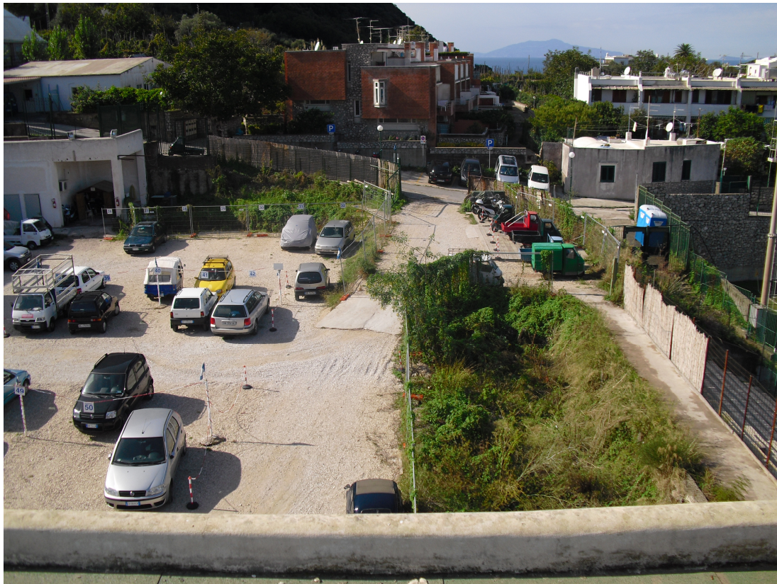
IMG. A01.07. - FOTO DELLO STATO DIE LUOGHI

PROGETTO DI FATTIBILITA' RELAZIONE ILLUSTRATIVA