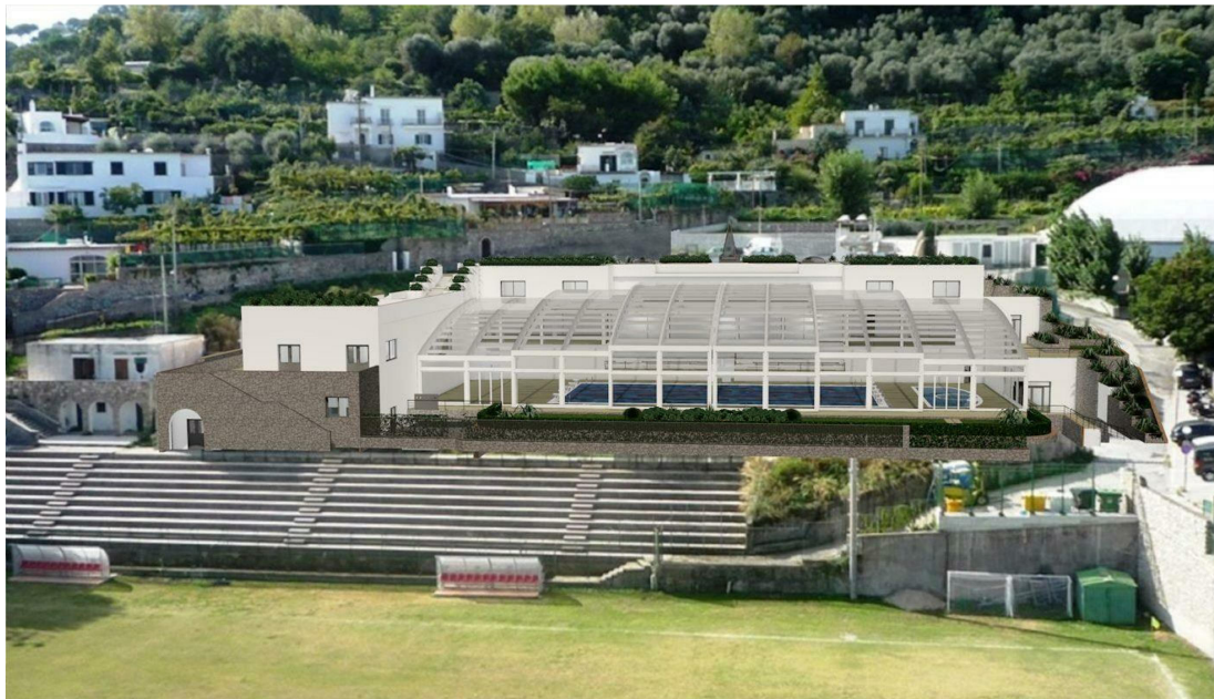
IMG. A01.11. - RENDER FRONTALE CON COPERTURA CHIUSA

PROGETTO DI FATTIBILITA' RELAZIONE ILLUSTRATIVA