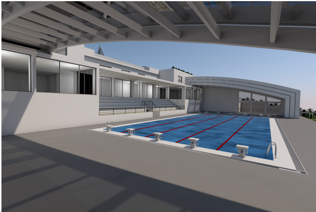
IMG. A01.13. - RENDER DELLE PISCINE CON COPERTURA APERTA

PROGETTO DI FATTIBILITÀ RELAZIONE ILLUSTRATIVA