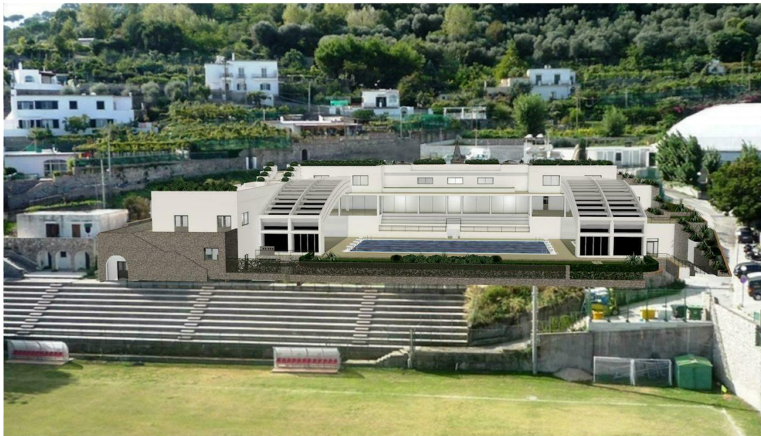
IMG. A01.12. - RENDER FRONTALE CON COPERTURA APERTA

PROGETTO DI FATTIBILITA' RELAZIONE ILLUSTRATIVA