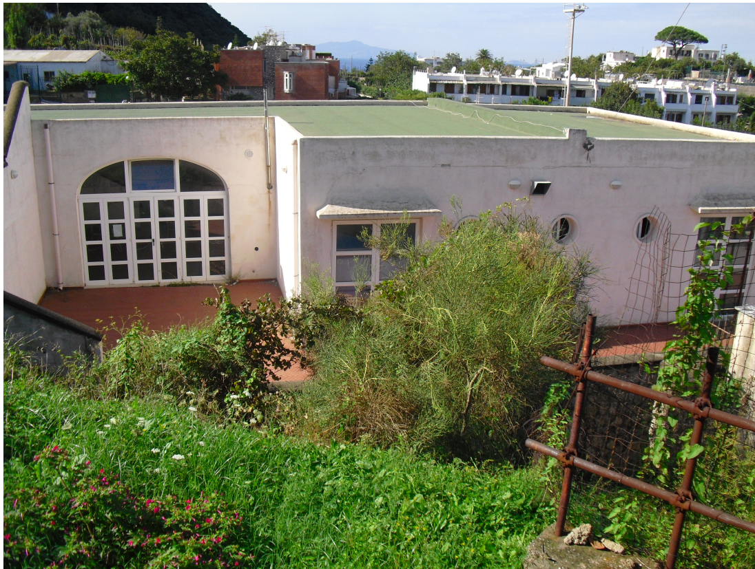
IMG. A01.08. - FOTO DELLO STATO DEI LUOGHI

PROGETTO DI FATTIBILITA' RELAZIONE ILLUSTRATIVA