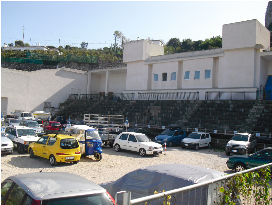
IMG. A01.04. - FOTO DELLO STATO DEI LUOGHI

PROGETTO DI FATTIBILITA' RELAZIONE ILLUSTRATIVA