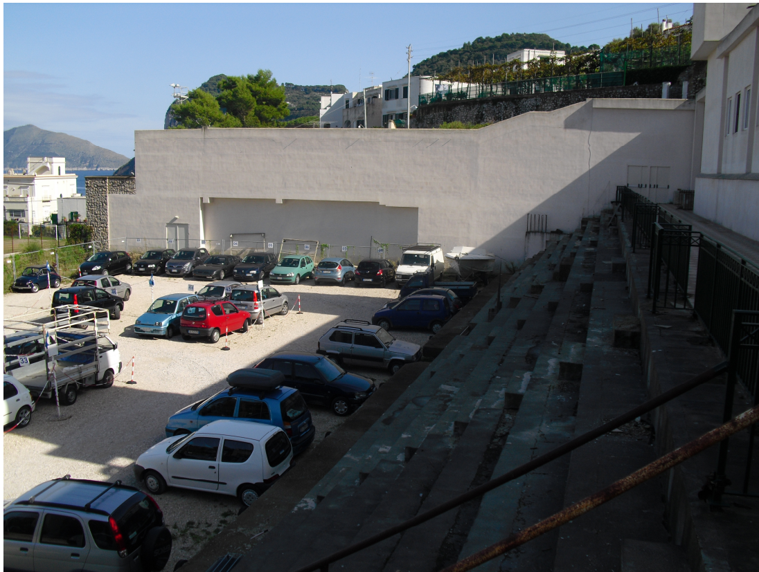
IMG. A01.05. - FOTO DELLO STATO DEI LUOGHI

PROGETTO DI FATTIBILITA' RELAZIONE ILLUSTRATIVA