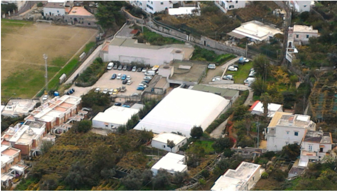
IMG. A01.02. - FOTO DELLO STATO DEI LUGHI

PROGETTO DI FATTIBILITA' RELAZIONE ILLUSTRATIVA