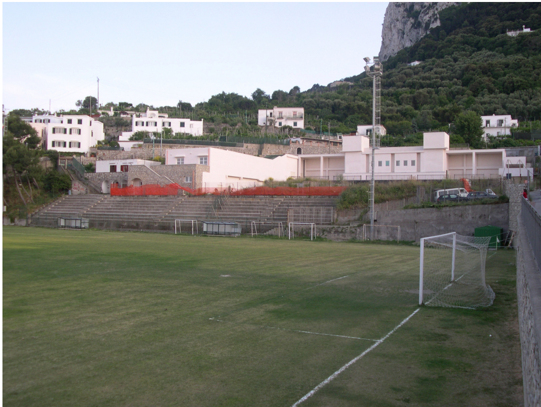
IMG. A01.03. - FOTO DELLO STATO DEI LUOGHI

PROGETTO DI FATTIBILITA' RELAZIONE ILLUSTRATIVA