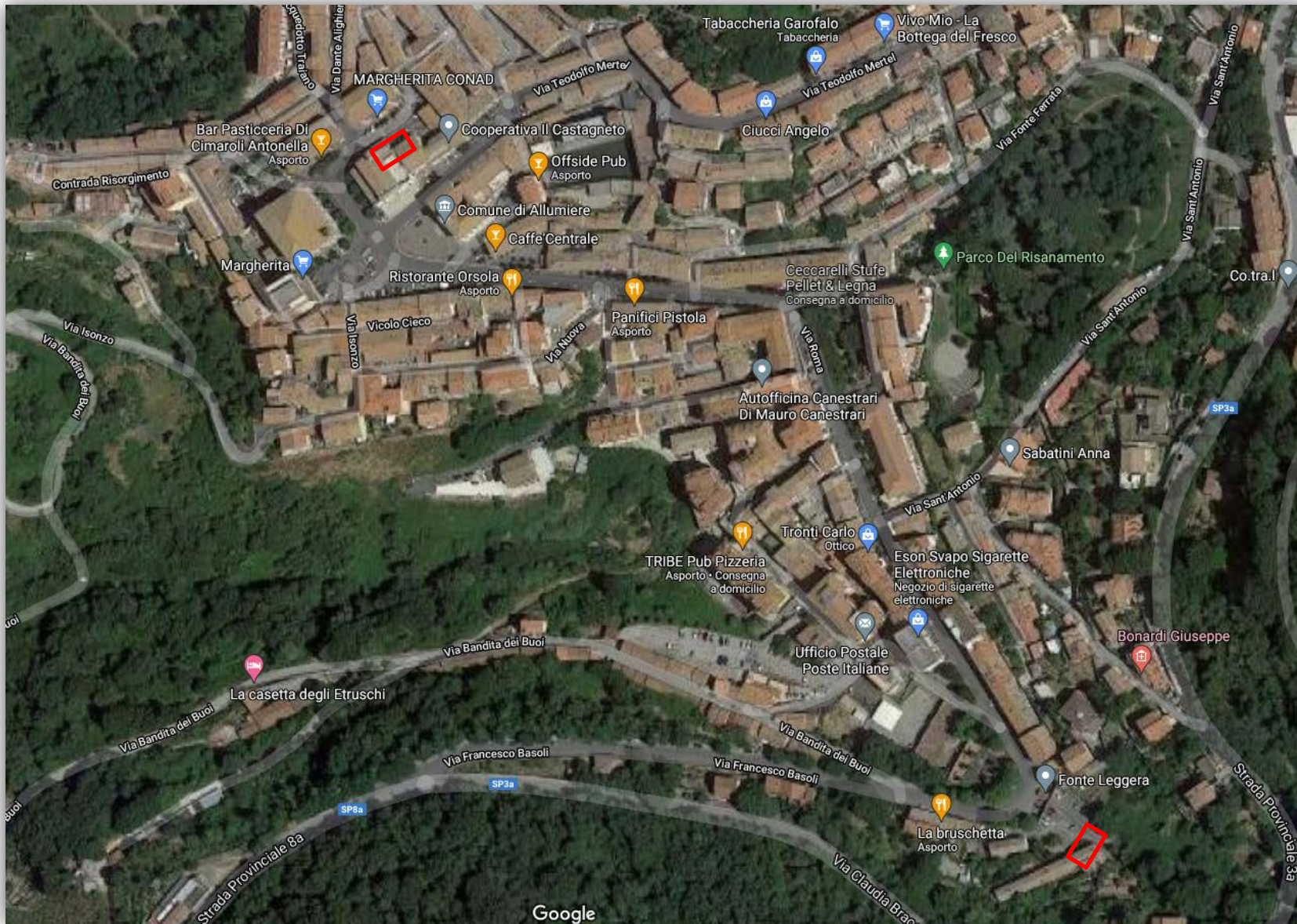
Stralcio foto aerea zona oggetto di intervento